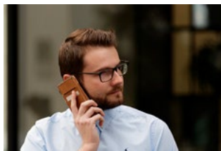
2 Wet arbeidsmarkt in balans (WAB)