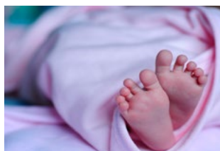
7 Varia Arbeidsrecht