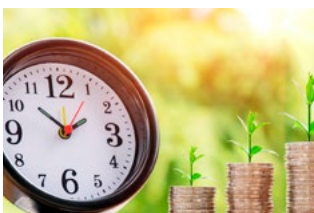
5 Wet tegemoetkomingen loondomein